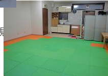
ふきのとう 2 室内