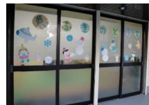
ふきのとう 2 外観